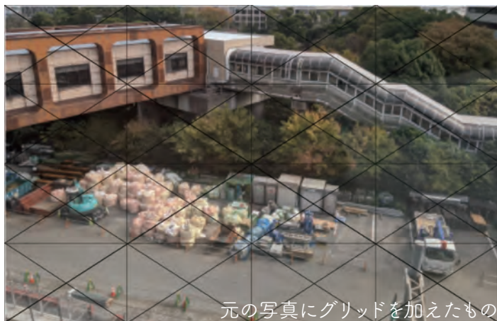
元の写真にグリッドを加えたもの